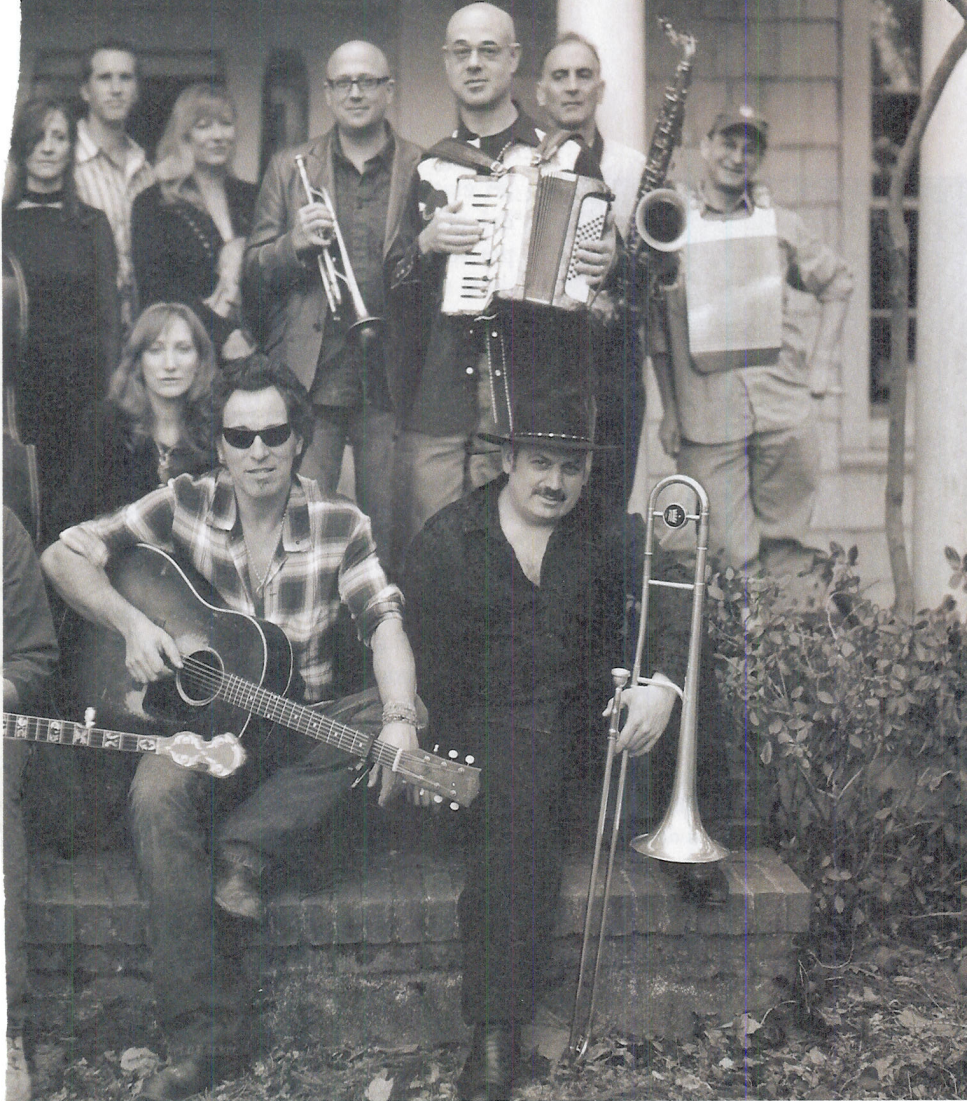
Arriba, el “boss” con la magnífica banda que le acompaña en su nuevo proyecto. Abajo, la portada del exquisito libro para coleccionista que acaba de editar Caelus Books.