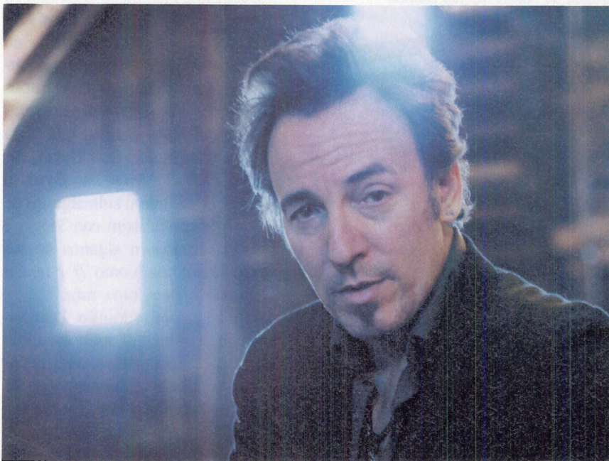
A los 55 años, el músico vive uno de los periodos más creativos de su carrera.

A pesar de que todo disco de Bruce Springsteen goza siempre de